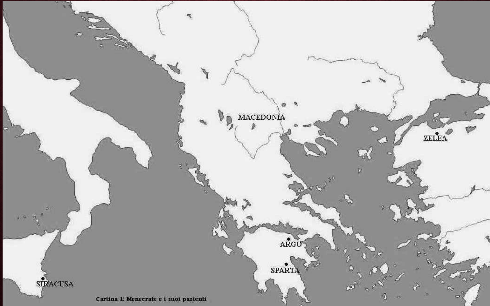
Cartina 1: Menecrate e i suoi pazienti