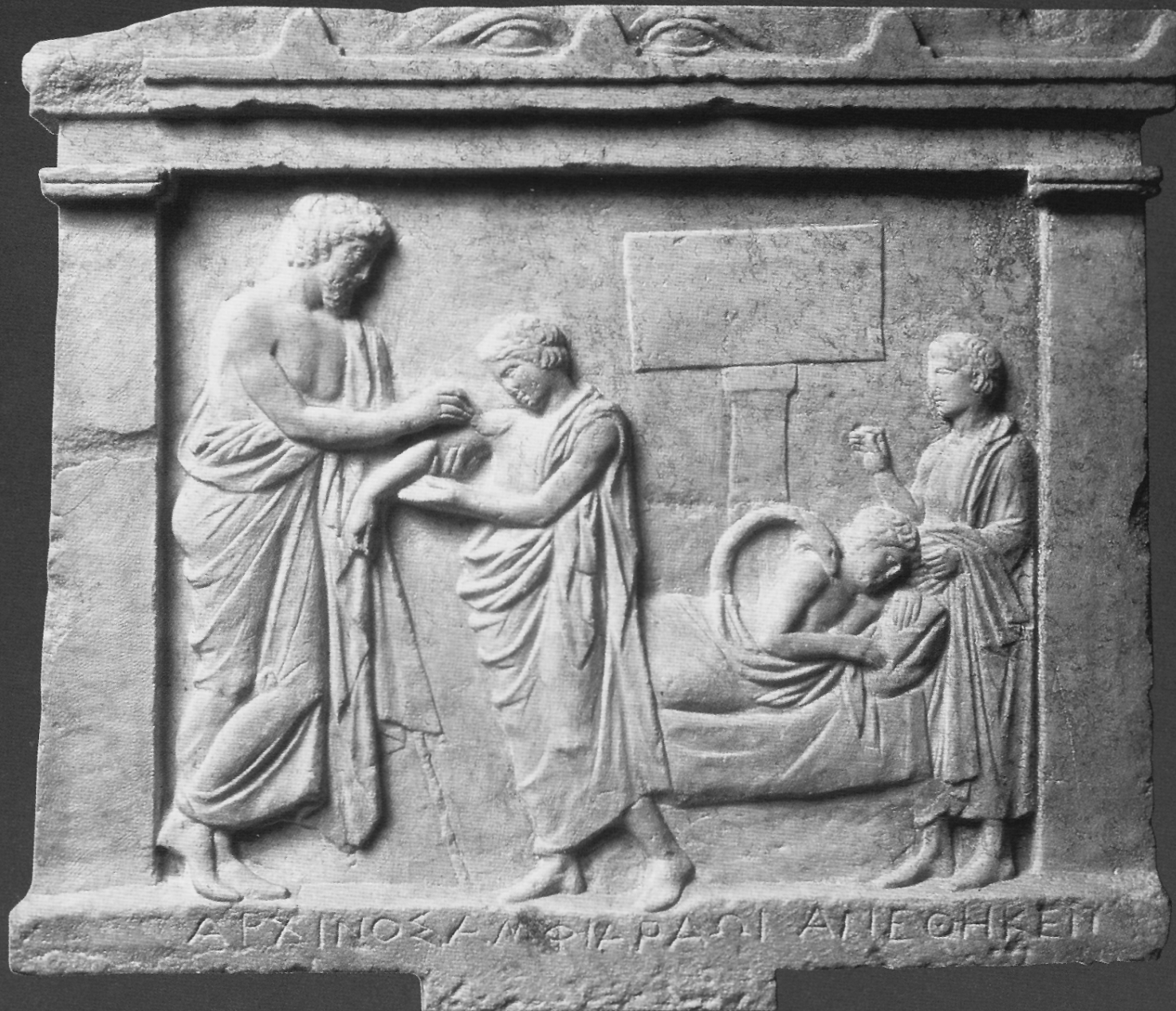
ATTICA, OROPOS, 4TH CENTURY BC, TEMPLE OF AMPHIARAOS, VOTIVE MARBLE RELIEF DEPICTING AMPHIARAUS HEALING ARCHINUS' SHOULDER