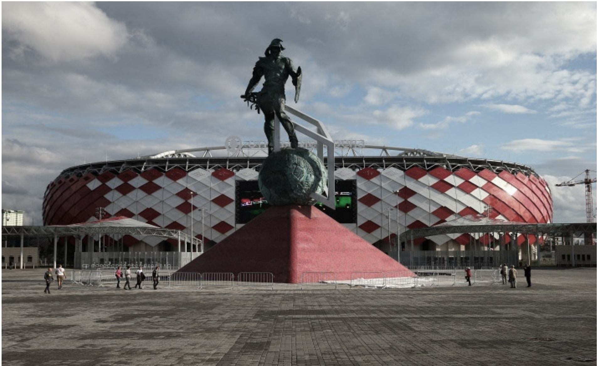
Gladiator, Spartak Stadion (Moscú 2014)