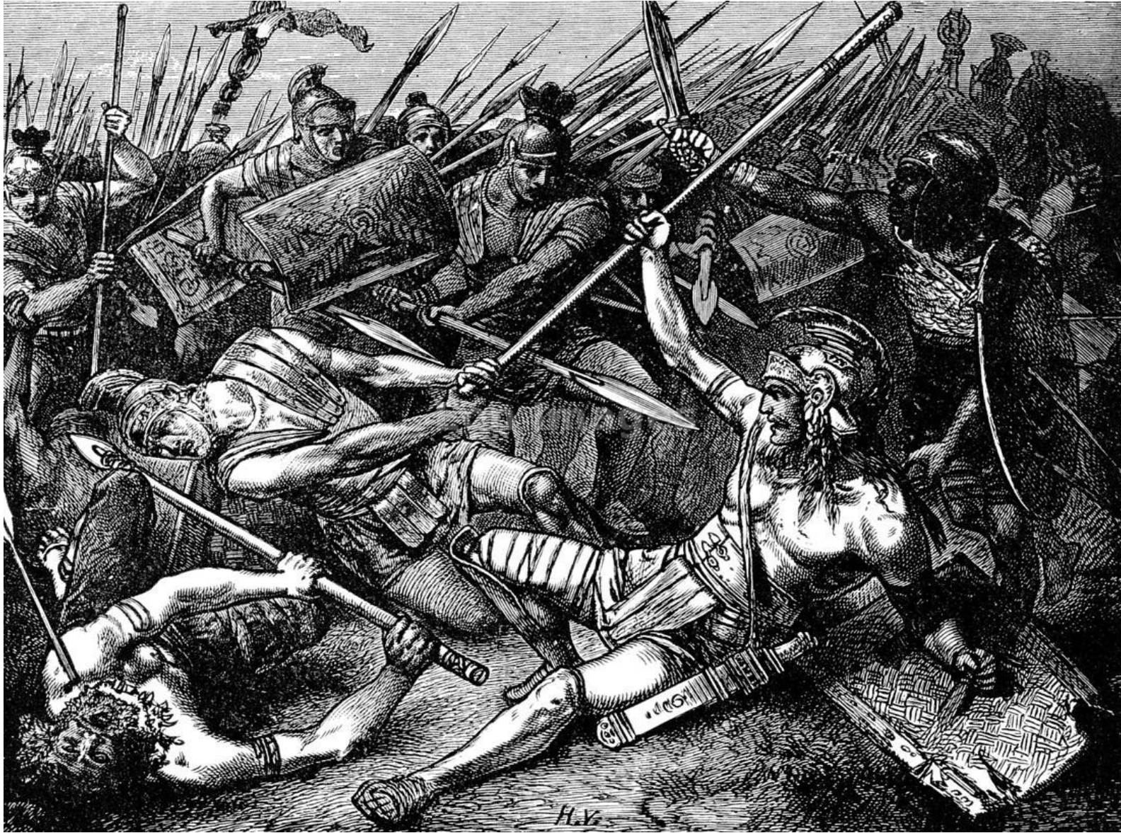
H. Vogel, Tod des Spartakus (1882)