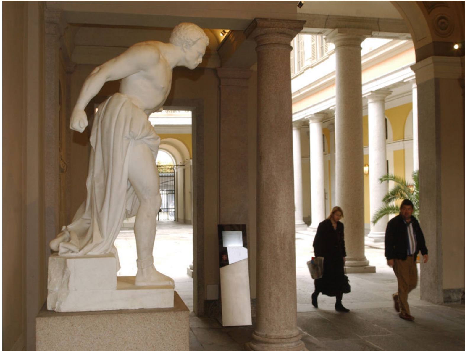
V. Vela, Espartaco (1847-49)