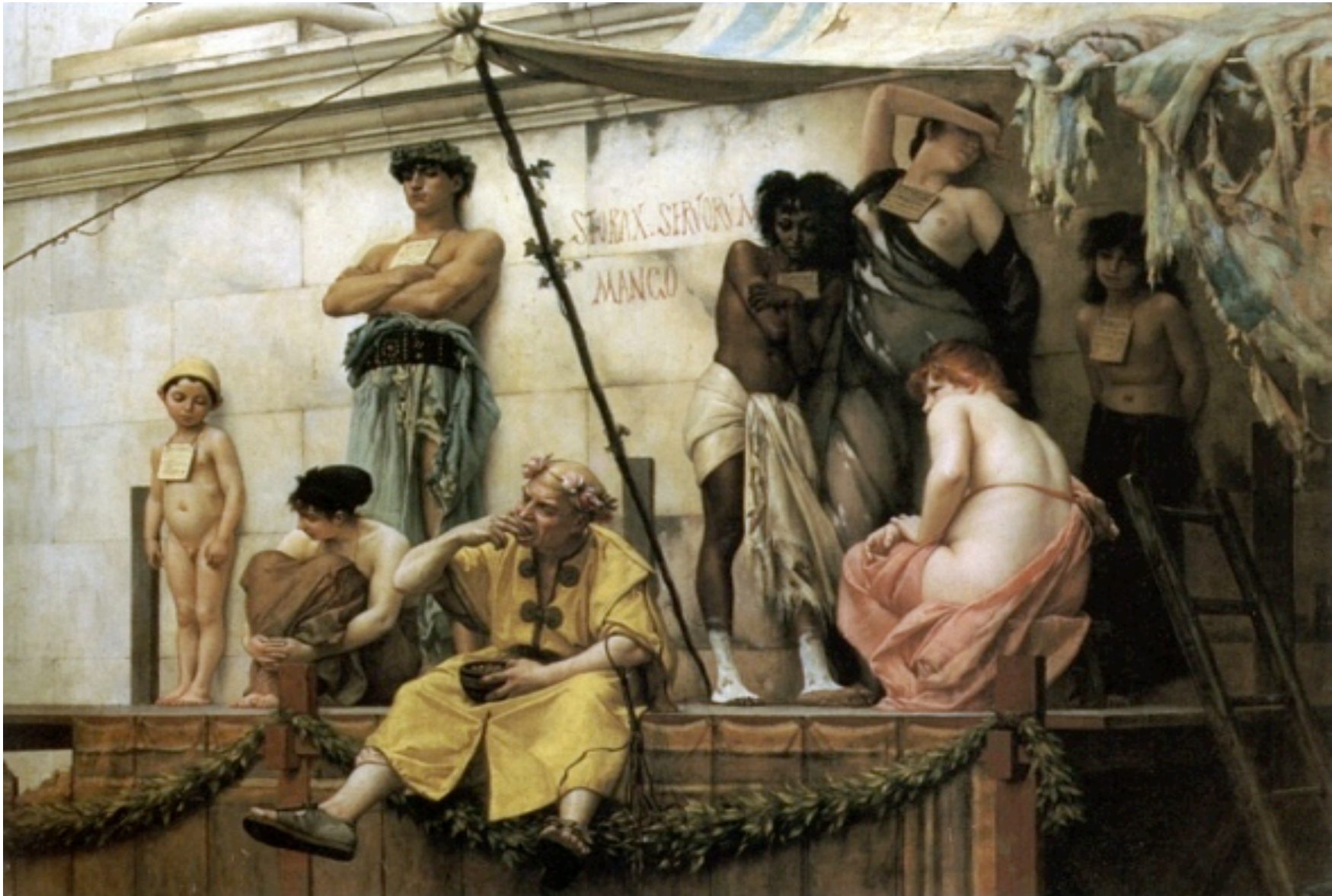
G. Boulanger, Mercado de esclavos (1888)