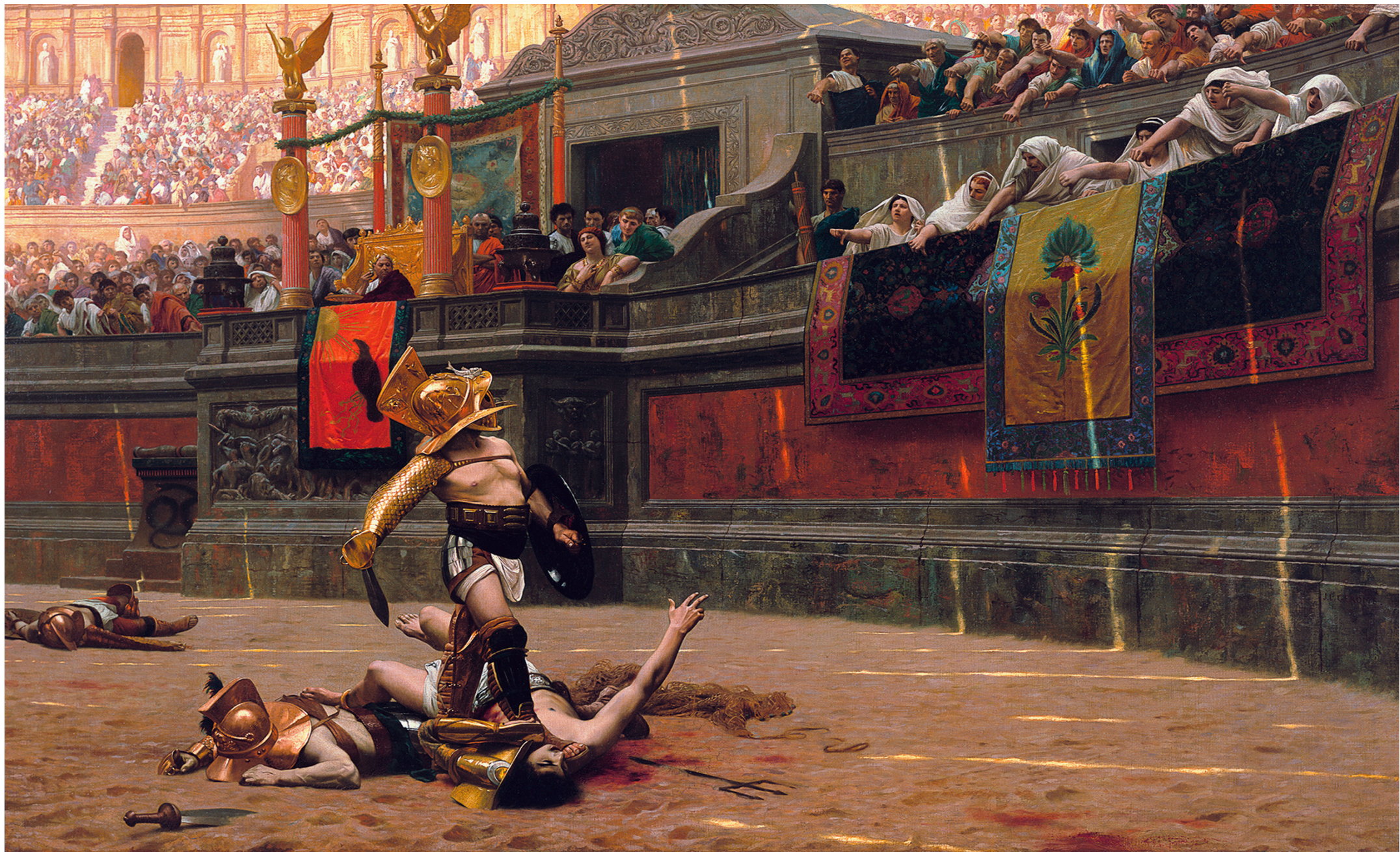
J. L. Gérôme, Pollice verso (1872)