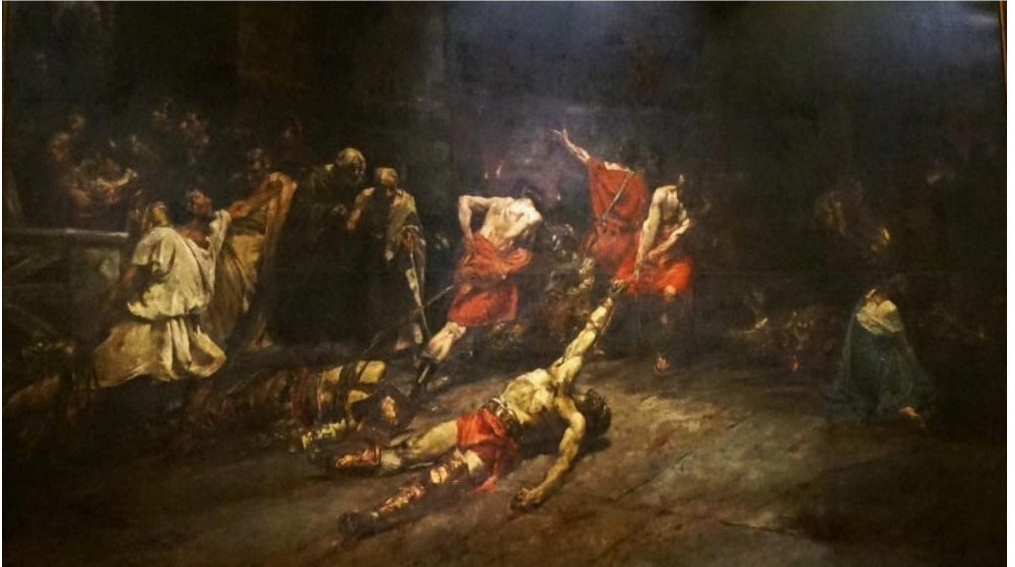
J. Luna Novicio, Spoliarium (1884)