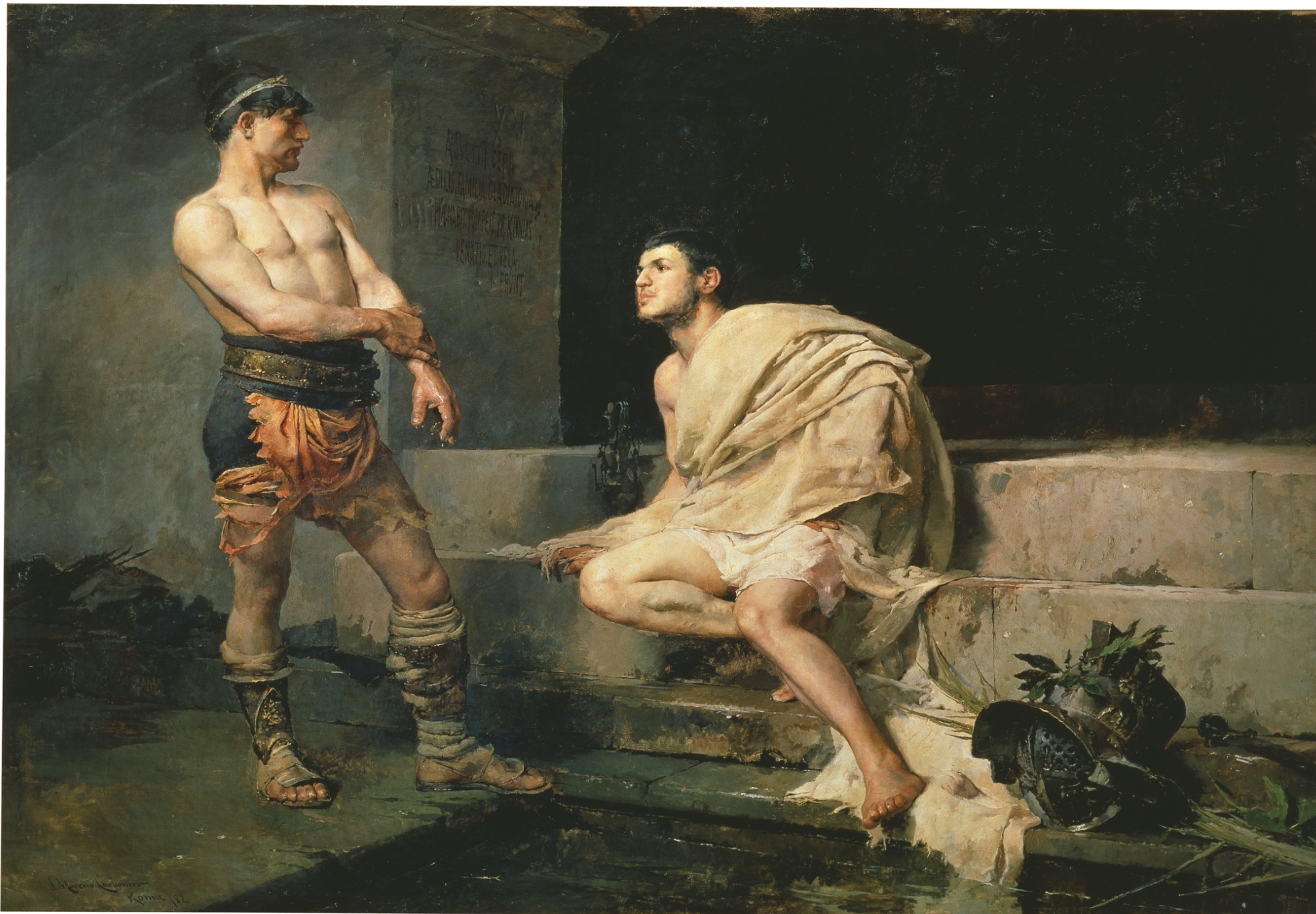
J. Moreno Carbonero, La meta sudante o Un episodio de la vida de Espartaco (1881)