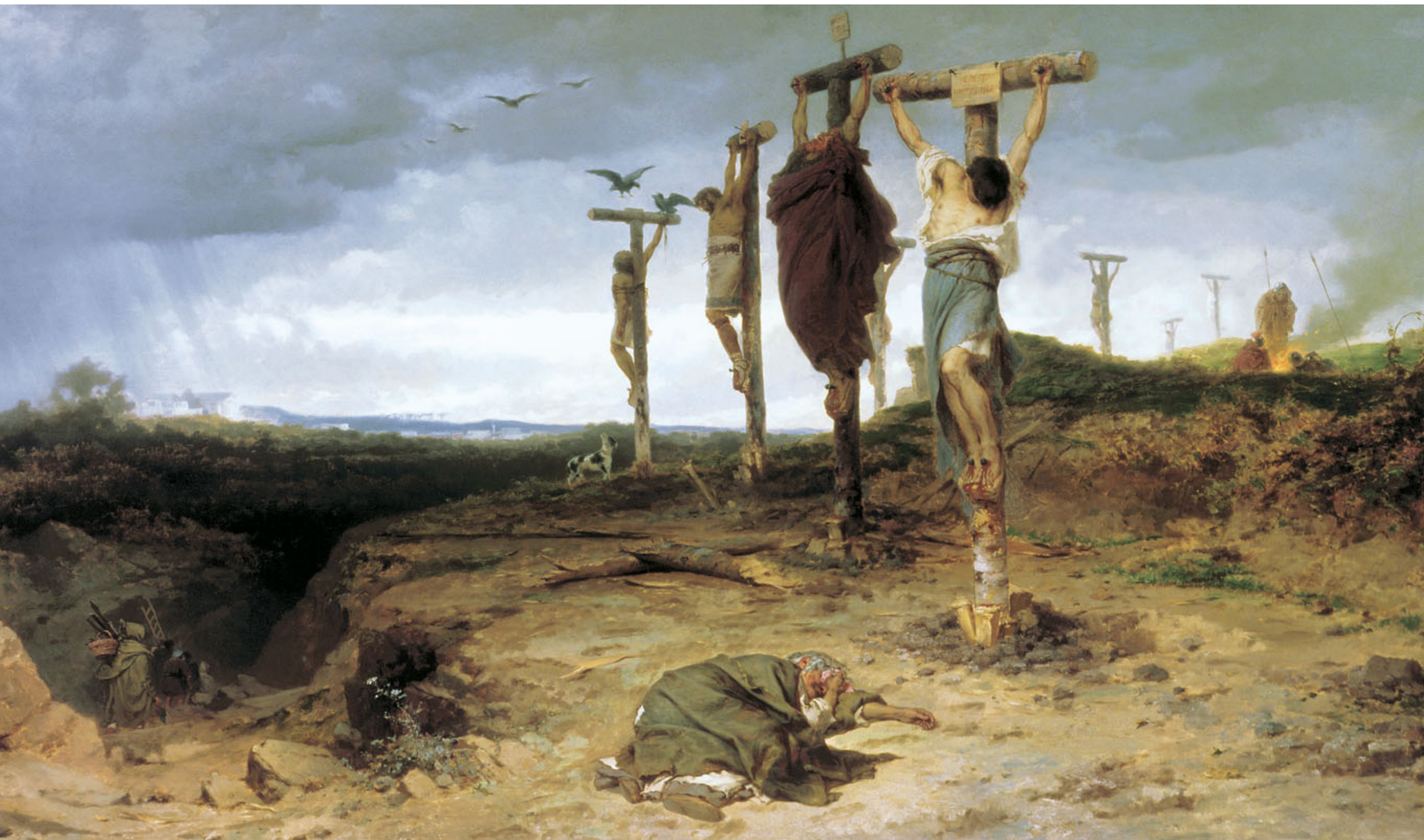
F. A. Bronnikov. Los esclavos crucificados (1878)