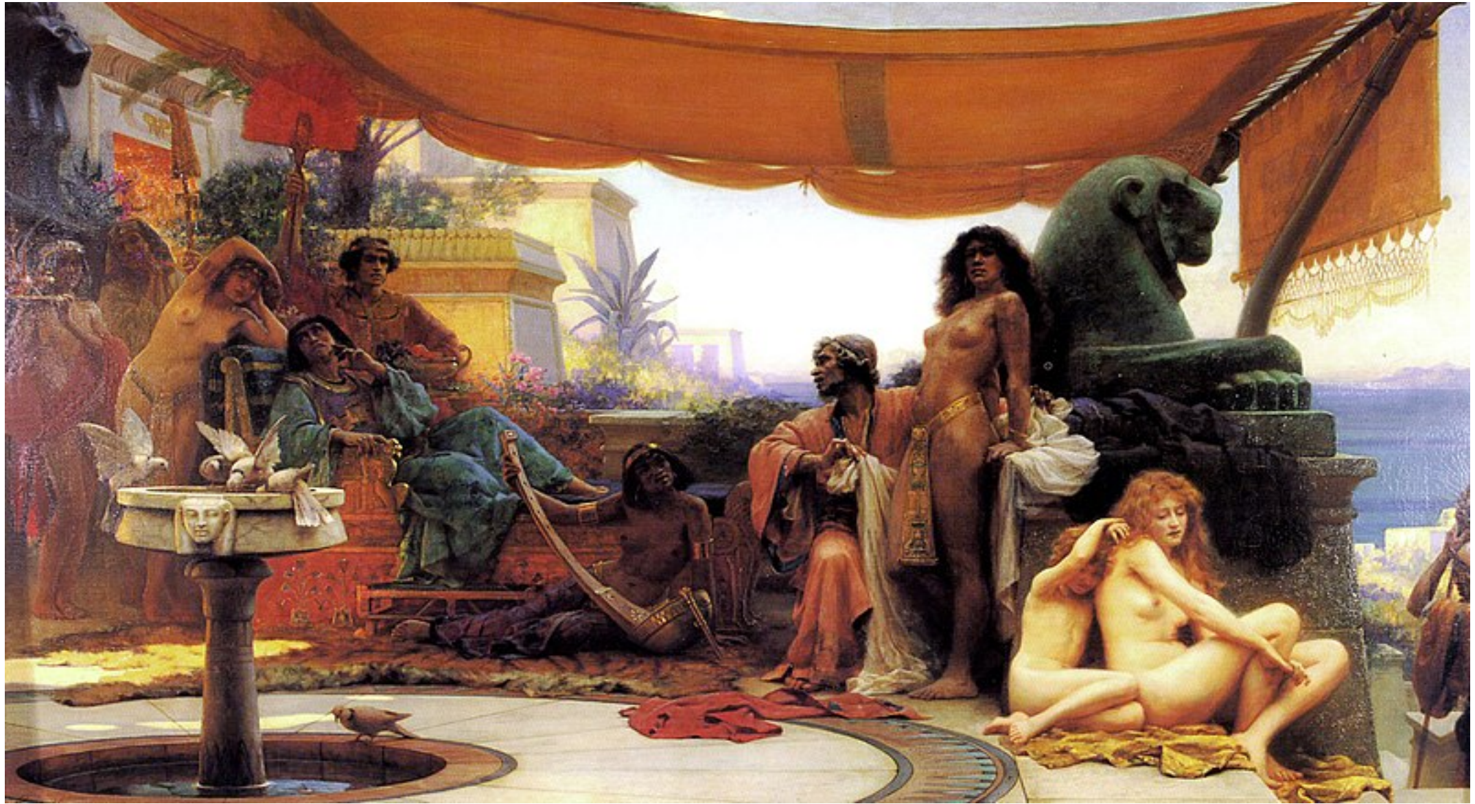
E. Normand, Bondage (1890)