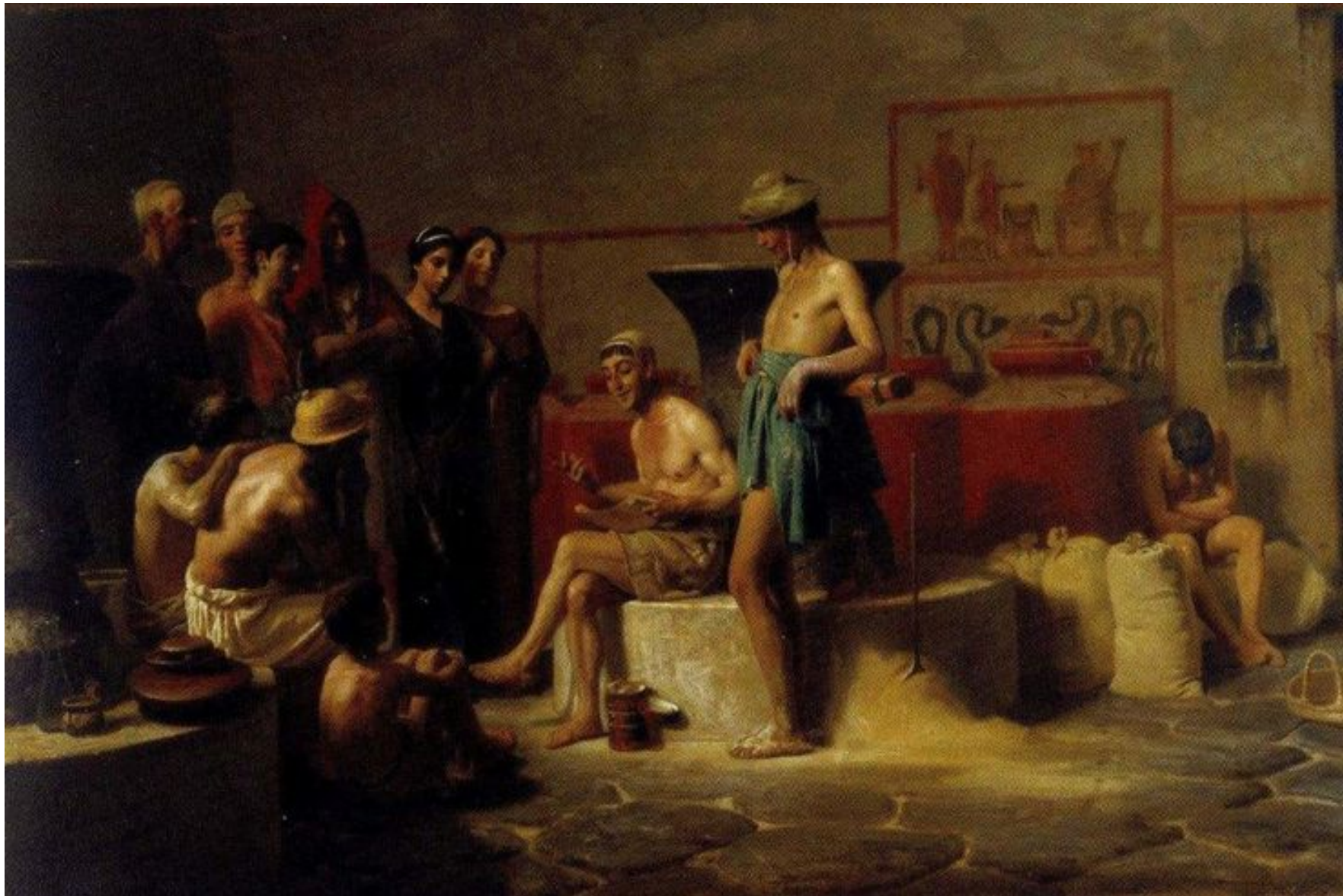
Camillo Miola, Plauto mugnaio (1864)